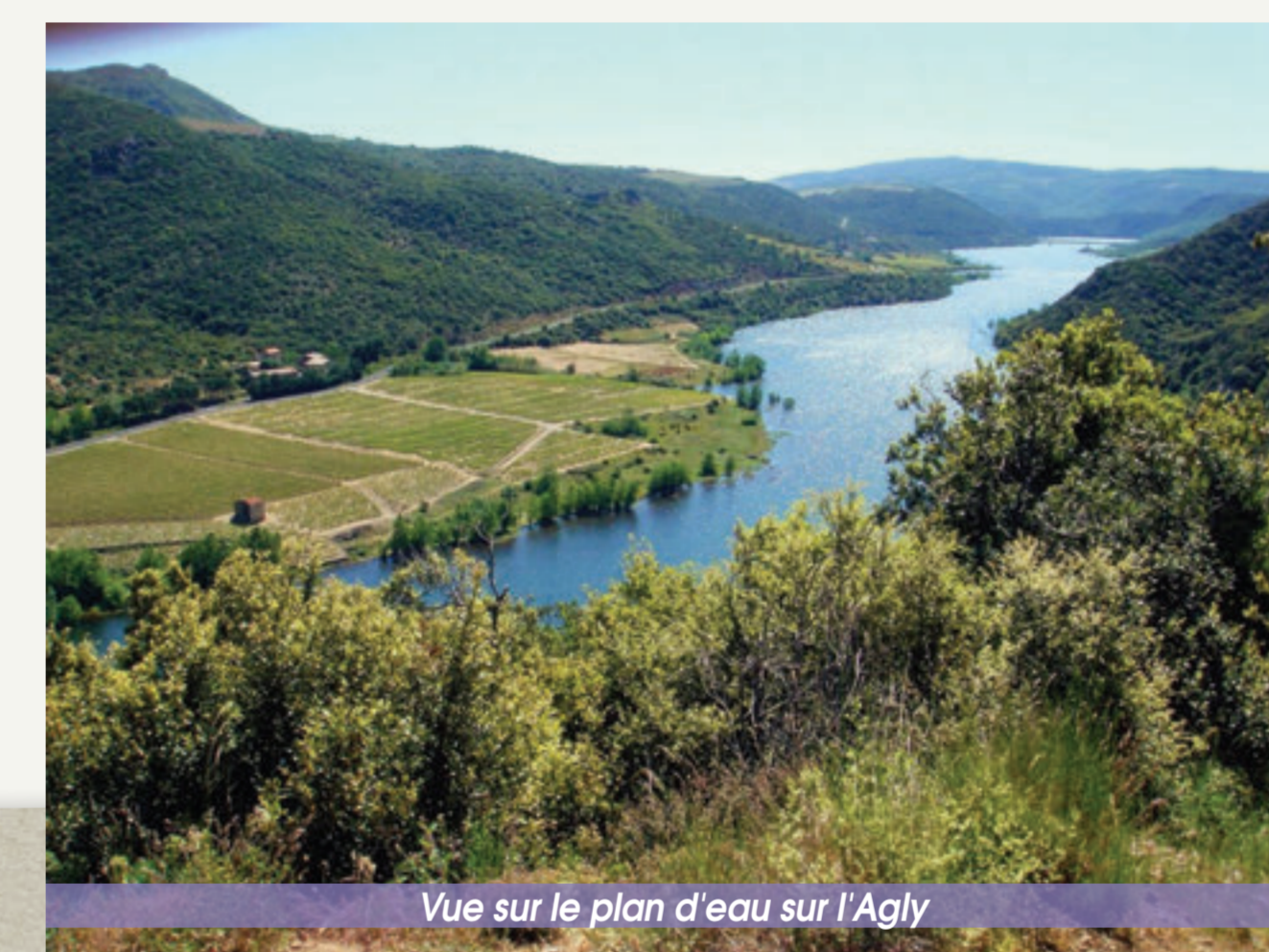
Vue sur le plan d'eau sur l'Agly

Le sentier vous fera découvrir le dolmen de las Apostados et le dolmen de las Colombinos, situés tous deux sur la commune de Trilla. Il vous invite également à la découverte des paysages de garrigues, typiques des territoires méditerranéens. Entre les plateaux de Taupels et du Camp del Prat en passant par le Rec de la Llèbre, vous aurez l'occasion d'apprécier les beaux panoramas qu'offre la richesse naturelle des Fenouillèdes.