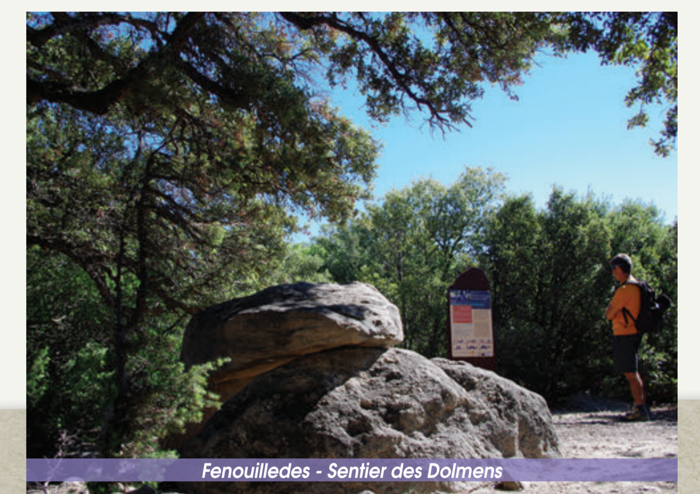
Fenouillèdes - Sentier des Dolmens